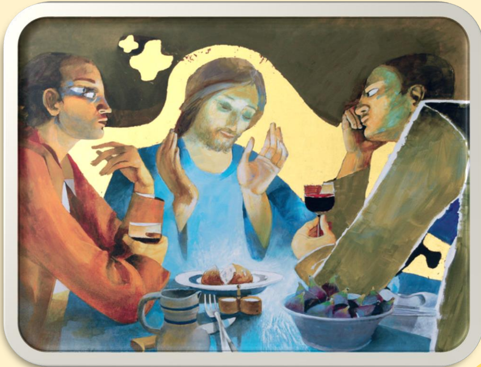
Arcabas (Jean-Marie Pirot) les disciples d'Emmaüs