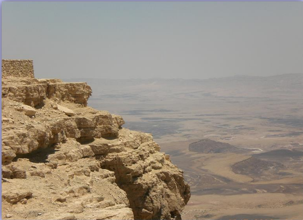
Désert du Néguev 2013